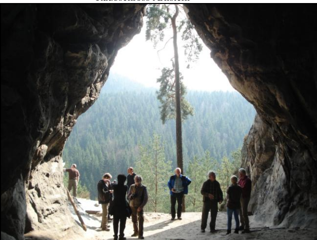
2. größte Felsentor Kleinstenhöhle 12m breit 10m hoch