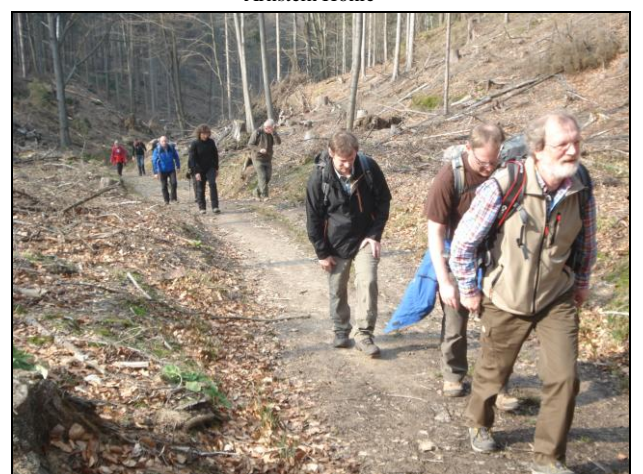
Anstieg zum Großer Pohlshorn