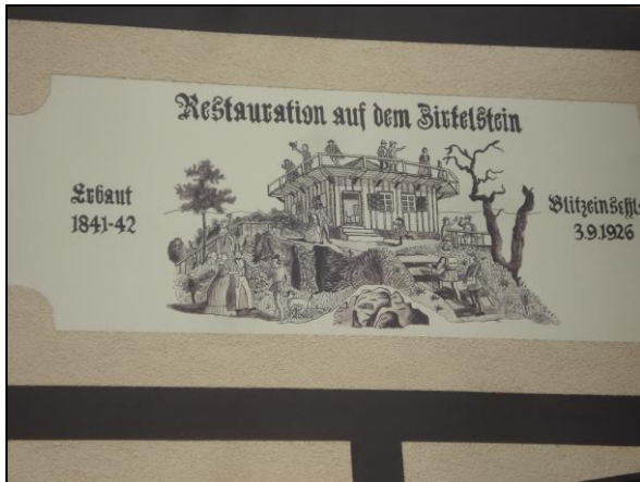
Relief in Reinhardtsdorf Am 3. September 1926 wurde die Bergwirtschaft bei einem schweren Gewitter durch Blitzschlag in Brand gesetzt und brannte vollständig ab.