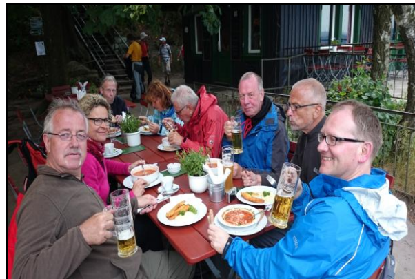
Rast auf Papststein

Ich habe nicht gedacht, dass die Wege leicht sind, sonst mittelschwer. Auf und Abstiege zählten auch dazu. Wir sind alle toll mit gewandert. Eigentlich, einen Abstecher zur Lichterhöhle, Eishöhle und Hampelhöhle mal ansehen, leider war die Zeit knapp Einige Wanderer/in müssten zur ungünstigen Rückreise antreten. Diese Lichterhöhle, zu besichtigen wird in der 9. Etappe Malerweg nachgeholt.