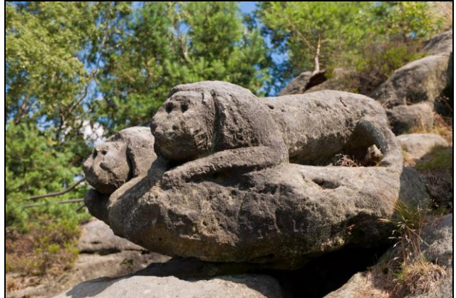
Kaiserkrone 350m, am südlichen Felsen sind zwei Löwen von unbekanntem Künstlern herausgemeißelt worden