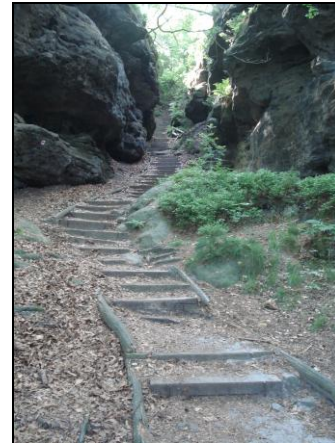
Aufstieg zum Papststein