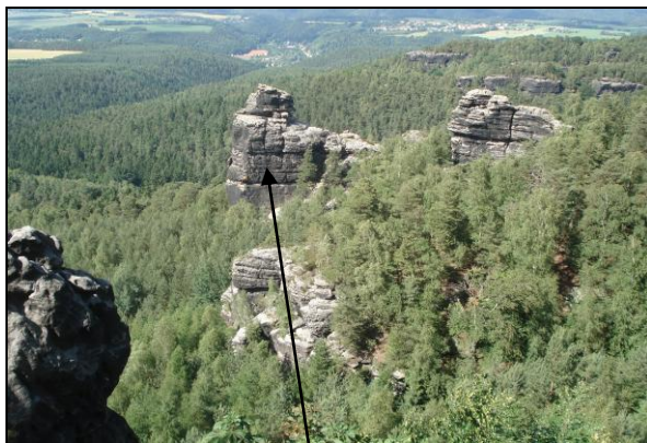
Blick zur Hunskirche