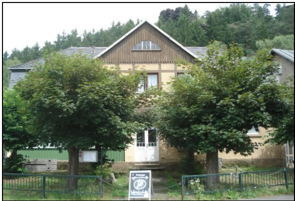
Ehemaliges Wanderheim mit Gaststätte Ottomühle