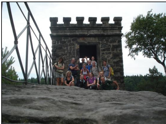
Kaiser-Wilhelm Feste (Bielablick)