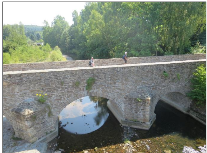
500 Jahre alten Steinbrücke