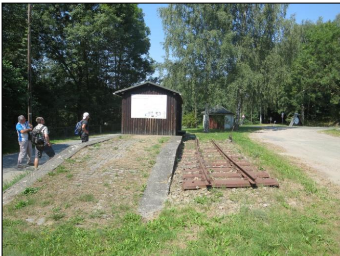
Ehemalige Rampe für Bergbau