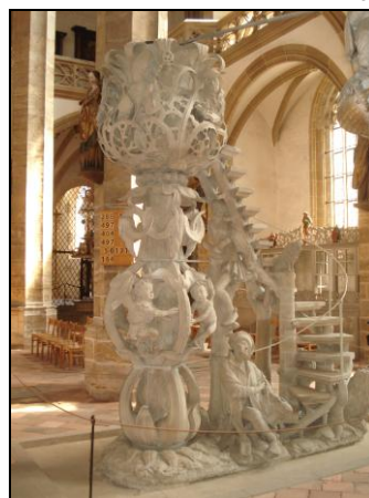
Kanzel aus Sandstein