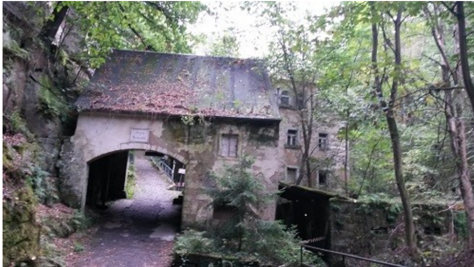
Lochmühle im Liebenthaler Grund

Bedauerlicherweise durften wir nicht weiter durch den Liebenthaler Grund nach Daubemühle wandern, da das Gebäude einsturzgefährdet ist. So mussten wir bergauf nach Mühlisdorf laufen. Der Liebenthaler Grund ist ein romantischer Wanderweg.