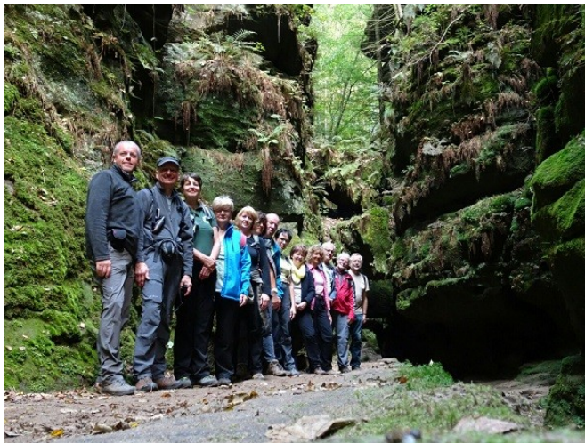
In der tiefen dunklen Schlucht des Uttewalder Grundes mit der Engstelle des Felsentores.

Bedauerlicherweise durften wir nicht weiter durch den Liebenthaler Grund nach Daubemühle wandern, da das Gebäude einsturzgefährdet ist. So mussten wir bergauf nach Mühlisdorf laufen. Der Liebenthaler Grund ist ein romantischer Wanderweg.