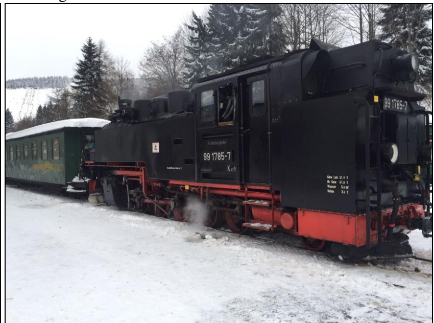
Bf Oberwiesenthal Schmalspurbahn