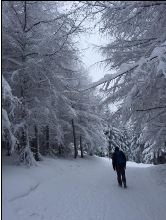
30 – 50 cm Schnee