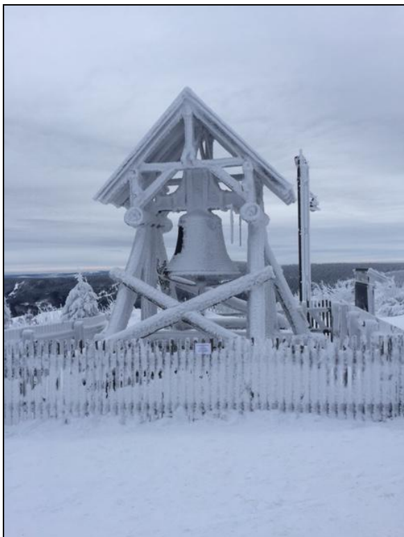
Friedensglocke 1,6 t, 1,30 hoch