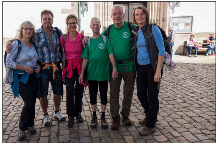
am Ziel Freiberg