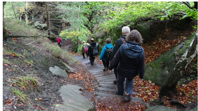
850 Stufen sollen es vom Brand zum Tiefen Grund sein