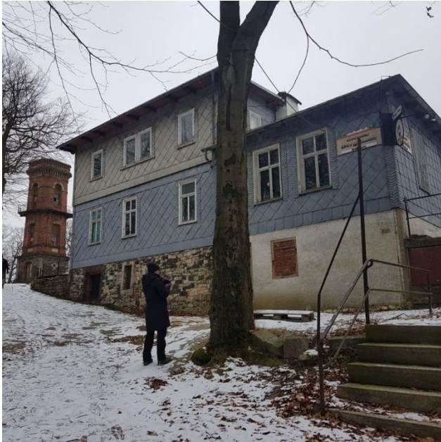
Kottmar 538 m hoch

Bergbaude ( leider zu und der Aussichtsturm auch )