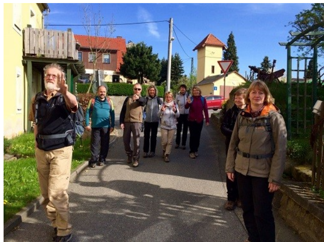
Start von Altendorf