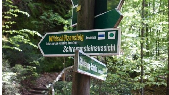
Abstecher vom Malerweg