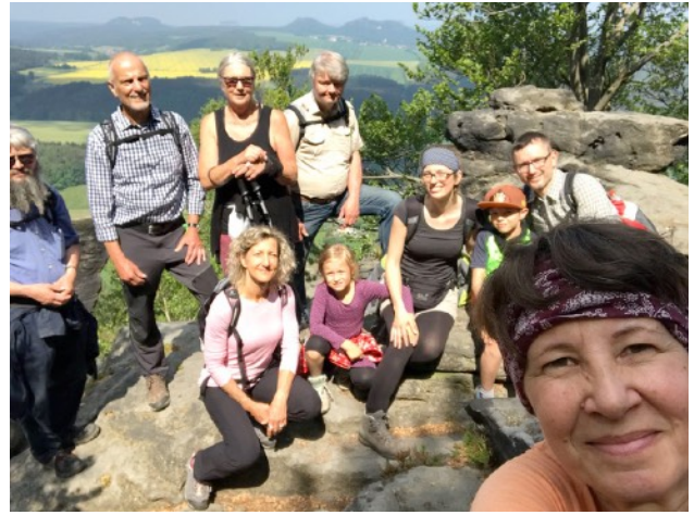
Am Fuß des Kleinen Zschirnstein