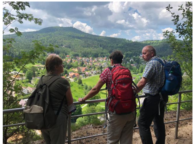
Blick zu Hochwald