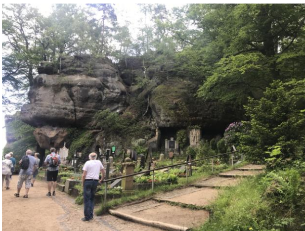
schönster Friedhof von Sachsen