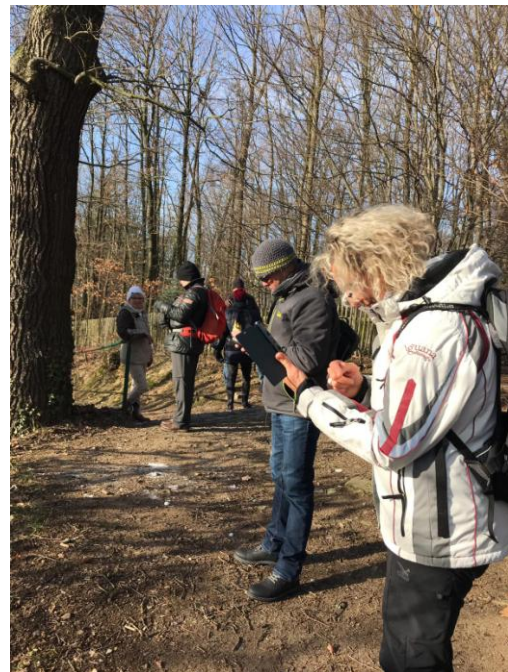
Guck Smartphone, wo wir gerade im Waldwege aufs