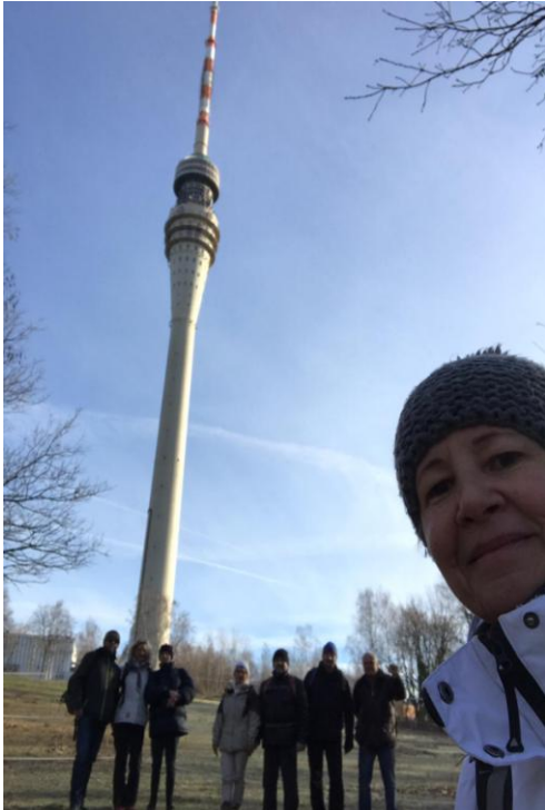
Blick zum Fernsehturm