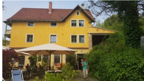
Schokoladencafe & Manufaktur