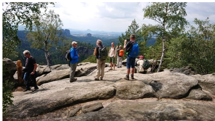
Blick zum Lilienstein

Das war meine erste Wanderführung für unsere Gruppe, es hat uns Spaß gemacht wie immer. Zitat: Wenn man die Natur wahrhaft liebt, so findet man es überall schön.