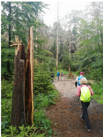
Auf dem Weg nach Schmilka