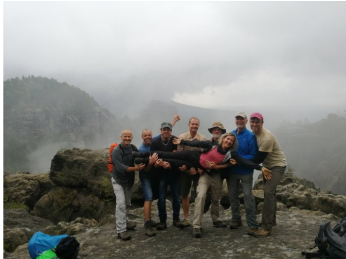
Das Schneewittchen und die sieben Zwerge