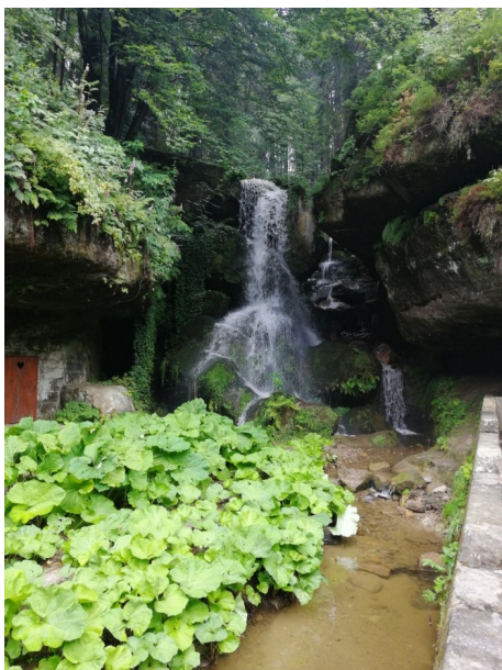
Lichtenhainer Wasserfall nach Öffnen des Schwallwehres