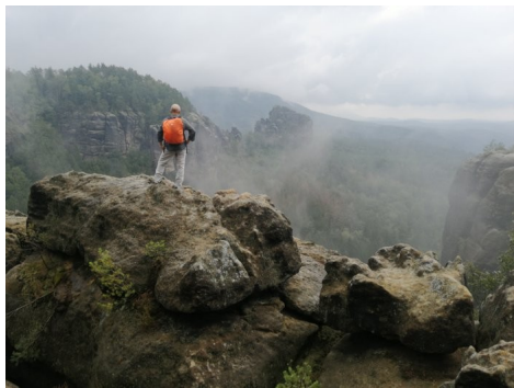
Blick über Carolafelsen