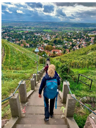
Spitzhaustreppe 397 Stufen