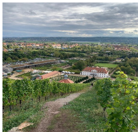
Blick zum Schloss Wackerbarth