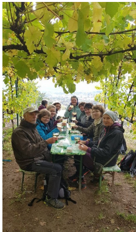
Federweißer & Weißwein