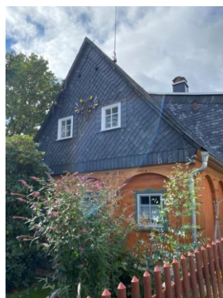
Die vielen schönen Umgebendehäuser