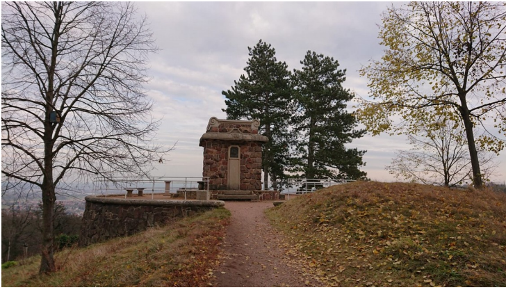
Bismarckturm auf der Herrenkuppe