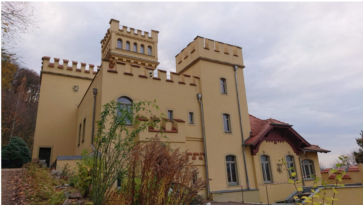
Weißes Schloss zur Zeit im Renovierung