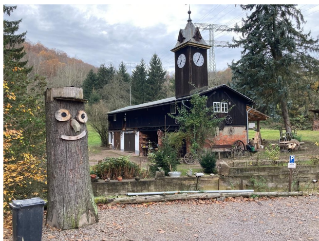
Uhrturm am Obermühle