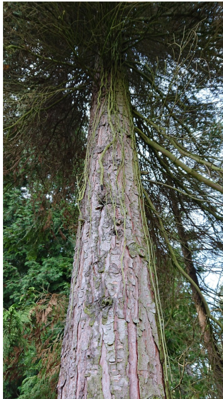
Sind über 3.200 verschiedene Baum- und Straucharten aus allen Kontinenten zu sehen, besonders schön ist das Nordamerikanisches Teil