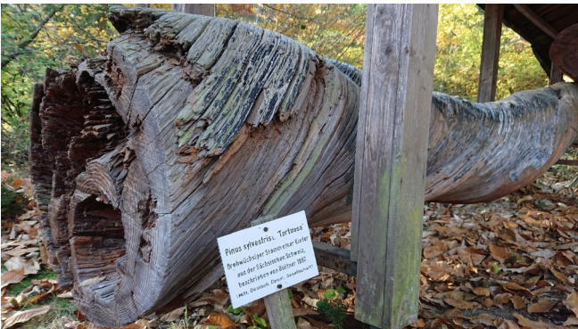
Drehwüchsiger Stamm aus der Sächsische Schweiz 1897