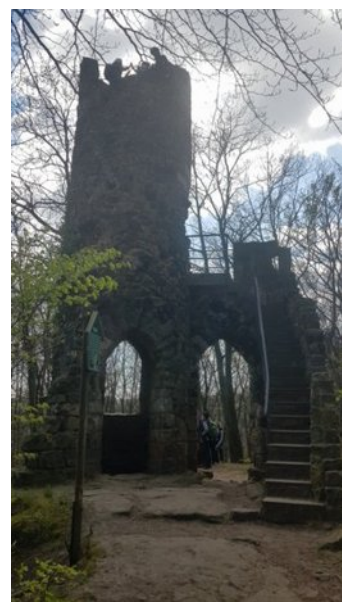
Schomburg in Bad Schandau