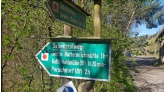
Start von Ulbersdorfer Mühle